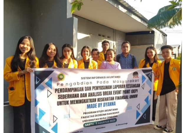
Gambar 4. Dokumentasi Kegiatan Pengabdian

Dokumentasi Kegiatan adalah sebagai berikut: