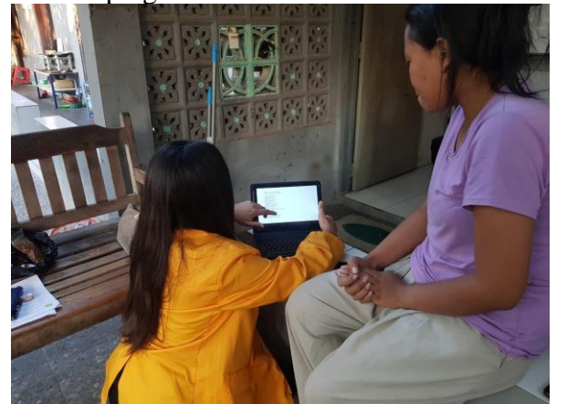
Gambar 6. Dokumentasi Pelatihan dan Pendampingan Terkait dengan Analisis BEP