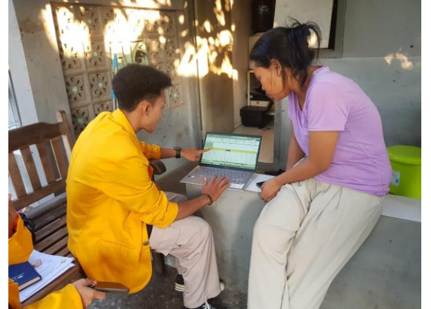
Gambar 5. Dokumentasi Pelatihan sekaligus Pendampingan Pembuatan Exel