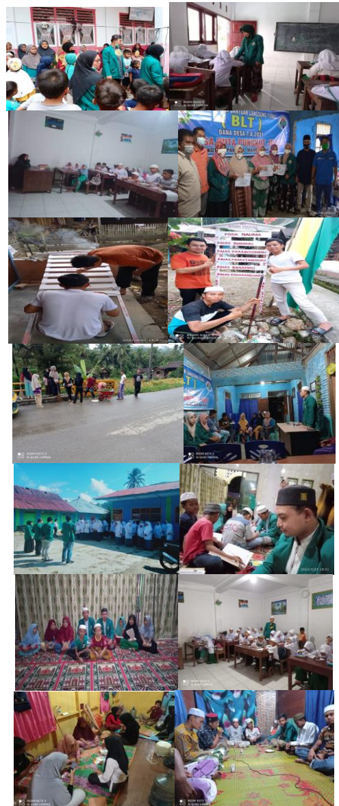
Gambar 2. Kegiatan-kegiatan yang terealisasi pada pengabdian

Kegiatan pengabdian masyarakat yang sudah terlaksana diharapkan dapat menjadi nilai dan semangat yang berkelanjutan bagi masyarakat Hutapungkut Julu, terutama dalam hal mengembangkan ekonomi dan budaya masyarakat desa.