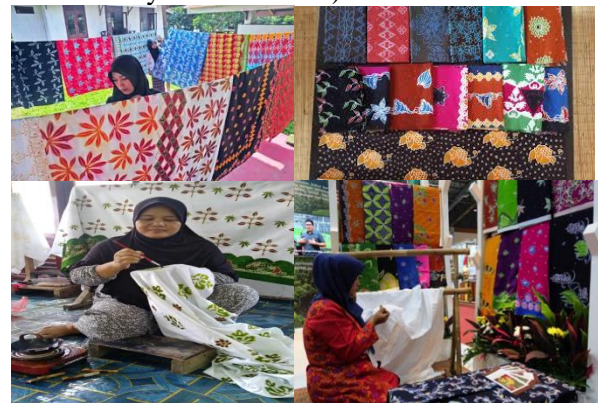
Gambar 3 : Batik Bono dan pembuatannya , 2021

Batik bukanlah sekadar kain atau busana tertentu, tapi proses membuat suatu motif dengan berbekal sebuah alat bernama canting yang dilengkapi lilin atau malam. Seiring kemajuan teknologi para pembatik pun akhirnya menciptakan banyak motif, corak, warna, dan desain batik yang bisa digunakan oleh masyarakat luas. Sampai saat ini, para pengrajin batik hingga desainer profesional juga masih menciptakan motif-motif batik baru dengan sentuhan kekinian yang dikombinasi dengan teknik tradisional.( Hertati & Syafarudin. 2018).