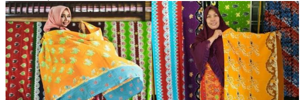
Gambar 2 : Batik Bono dan pembuatannya , 2021

KTM Telang adalah Batik Tulis dan batik cap atau printing. Harga batiknya pun berbeda antara batik tulis dan batik cap. Saat ini Batik KTM Telang sudah banyak dipesan oleh masyarakat di KTM Telang Kab. Banyuasin Sumatera Selatan. Dengan mengetahui makna yang tersirat akan membentuk satu kesepahaman di tengah masyarakat sehingga mereka mencintai dan berusaha untuk menjaga kebudayaan yang mereka miliki.( Hansen,et,all, 2018).