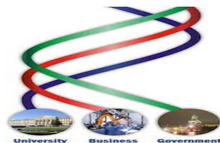
Gambar 4: Peran Triple Helix Inovasi Batik