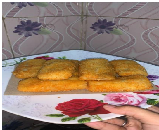
Gambar 3: Jenis kue Olahan

Kegiatan sosial dilaksanakan sesuai dengan rencana pada tanggal 14 September sampai dengan 15 oktober 2022 di Sumatra selatan. Hasil dari kegiatan PKM ini menghasilkan produk baru dari gadum dan buah-buahan. Memperhatikan lokasi usaha sangat penting untuk kemudahan pembeli dan menjadi faktor utama bagi kelangsungan