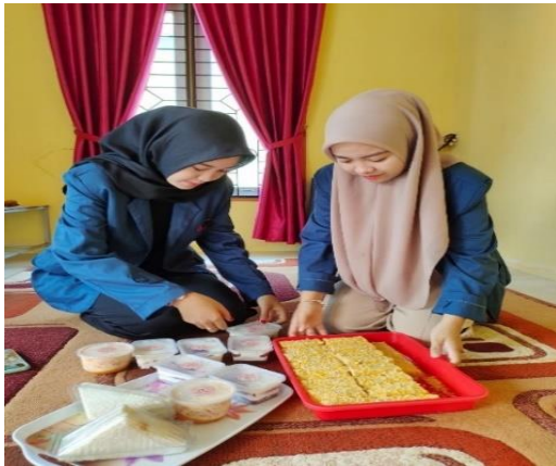
Gambar 1: Cara Olahan bisnis kue Online

cara mencapai tujuan akhir tersebut. Kemampuan UMKM atau industri dalam menghadapi tantangan persaingan dari para pesaing asingnya.