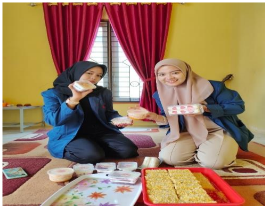
Gambar 2 : Jenis Olahan bisnis kue Online