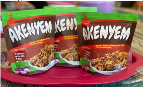
Gambar 4. Produk Bawang Goreng AKENYEM

Selama pelaksanaan kegiatan, terlihat adanya peningkatan kesadaran dari IKM Karya Mandiri terhadap pentingnya branding dan identitas produk dalam membangun daya saing, khususnya dalam menghadapi pasar nasional. Melalui proses edukasi dan diskusi yang interaktif, pelaku IKM mulai memahami bahwa elemen-elemen seperti desain kemasan, logo, pemilihan warna, serta narasi produk merupakan bagian integral dari strategi branding. Komponen-komponen tersebut tidak hanya berfungsi sebagai penanda visual, tetapi juga memainkan peran penting dalam membentuk persepsi konsumen terhadap kualitas, nilai, dan keunikan produk. Pemahaman ini menjadi langkah awal yang krusial dalam membangun citra merek yang kuat dan konsisten sebagai dasar untuk memperluas jangkauan pasar secara lebih strategis.