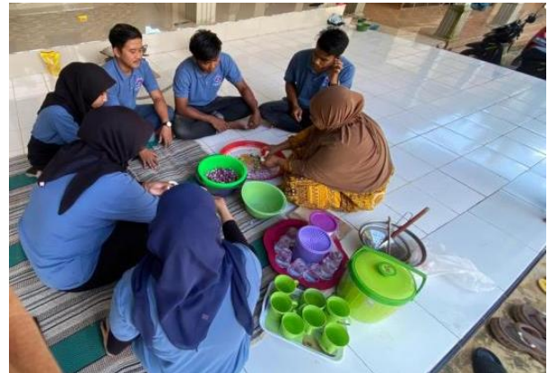
Gambar 2. Membantu Kegiatan Proses Produksi

Selain memberikan pelatihan digital marketing, kegiatan pengabdian ini juga memberikan kontribusi langsung pada aspek produksi di IKM Karya Mandiri. Tim pelaksana turut terlibat dalam proses pendampingan teknis, yang mencakup tahapan pengupasan, pengirisan, hingga penggorengan bawang merah. Keterlibatan ini bertujuan untuk meningkatkan efisiensi kerja serta memastikan konsistensi kualitas produk secara keseluruhan. Pendampingan di lini produksi tidak hanya memperkuat kapasitas operasional IKM, tetapi juga menjadi fondasi penting dalam menjaga standar mutu sebagai bagian dari strategi keberlanjutan bisnis.