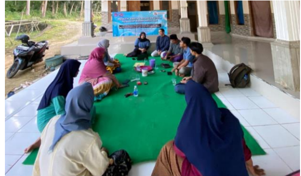
Gambar 5. Sosialisasi pada Pelaku IKM Karya Mandiri

pesanan yang dilakukan secara langsung melalui platform media sosial setelah implementasi strategi tersebut, menandakan pergeseran positif dalam perilaku konsumen terhadap kanal digital yang digunakan oleh UMKM.