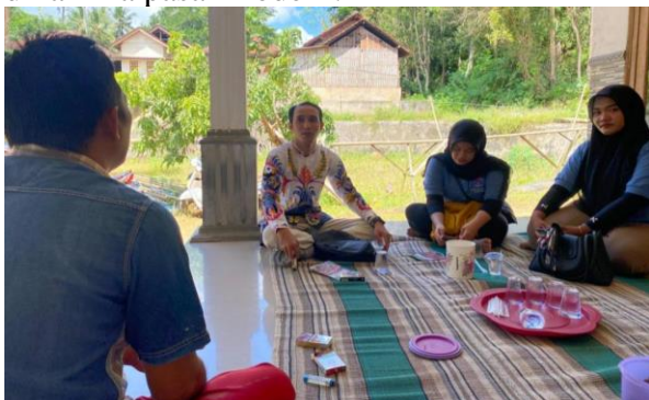
Gambar 1. Kunjungan Awal ke UMKM

Kegiatan edukasi yang diberikan berkontribusi signifikan dalam meningkatkan pemahaman pemilik IKM Karya Mandiri terhadap pentingnya peran media sosial dalam strategi pemasaran produk bawang goreng. Sebelum intervensi dilakukan, pemilik UMKM hanya mengandalkan aplikasi WhatsApp dengan memanfaatkan fitur story sebagai satu-satunya media promosi, yang tentunya memiliki keterbatasan dalam jangkauan dan efektivitas. Melalui pelatihan yang dilaksanakan, pemilik IKM mulai menyadari bahwa pemanfaatan berbagai platform media sosial seperti Instagram, Facebook, dan TikTok dapat memperluas cakupan pemasaran, meningkatkan visibilitas produk, serta membuka peluang interaksi yang lebih luas dengan konsumen potensial. Kesadaran ini menjadi langkah awal yang penting dalam membangun strategi digital yang lebih terstruktur dan adaptif terhadap dinamika pasar modern.